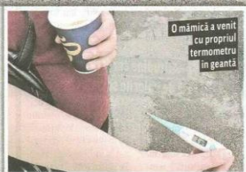
O mămică a venit cu propriul termometru în geantă