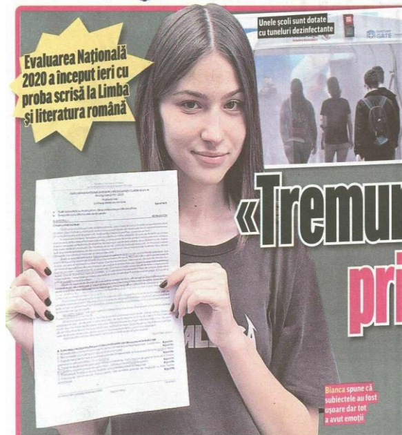
Unele școli sunt dotate cu tuneluri dezinfectante

Evaluarea Națională 2020 a început ieri cu proba scrisă la Limba și literatura română