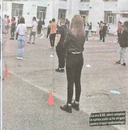
La ora 8.00, elevii așteptau în curtea școlii să fie strigați pentru triajul epidemiologic