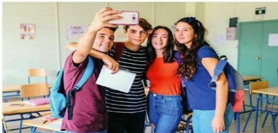
Elevii pot fi ajutați online să-și aleagă viitorul.