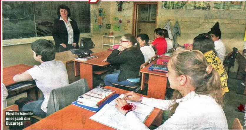
Elevi în băncile unei școli din București

Într-o conferință de presă susținută ieri după-amiază, Monica Anisie a declarat că "în funcție de data la care se reiau cursurile, Evaluarea Națională și bacalaureatul ar putea fi organizate în luna iulie. Nu va fi cuprinsă materia din semestrul II". Ministrul naționalei a mai spus, între altele, că "data exactă privind reluarea cursurilor se va stabili în funcție de evoluția pandemiei de coronavirus din România și în funcție de deciziile Comitetului Național pentru Situații de Urgență" și că "am anulat simulările examenelor naționale, evaluările pentru clasele II, IV și VI, dar și Olimpiadele și concursurile școlare".