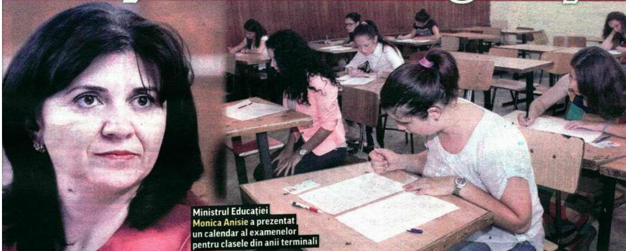
Ministrul Educației Monica Anisie a prezentat un calendar al examenelor pentru clasele din anii terminali

Școlile ar putea fi redeschise după încetarea stării de urgență și acest an școlar va fi încheiat, a anunțat ieri ministrul Educației, Monica Anisie, care a prezentat un calendar al examenelor pentru clasele din anii terminali. Astfel, Evaluarea Națională și Bacalaureatul ar putea avea loc în iulie și nu vor viza materia de pe semestrul al doilea.