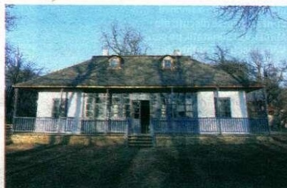
Casa lui George Enescu din Mihăileni, așa cum arăta în 2012 (foto stânga) și așa cum este astăzi, după ce a fost reabilitată (foto dreapta)

movici, George Enescu a revenit în repetate rânduri la casa sa din Mihăileni. A și concertat în sala de bal a târgului, alături de lehudi Menuhin. Printr-o scrisoare din 1918, Enescu a lăsat casa bătrânească în grija verișoarei sale, Eugenia Dimitriu. După moartea compozitorului, în 1955, casa a ajuns, pentru un preț de nimic, pe mâna unor vecini, cu toate că și unul dintre moștenitorii mai deținea o cotă-parte. De atunci, frumoasa sa casă cu cerdac și beci de pia-