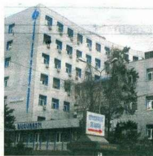
Spitalul Clinic de Urgență Floreasca