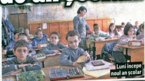
Luni începe noul an școlar

În magazine au apărut de mai bine de o lună standurile cu rechizite