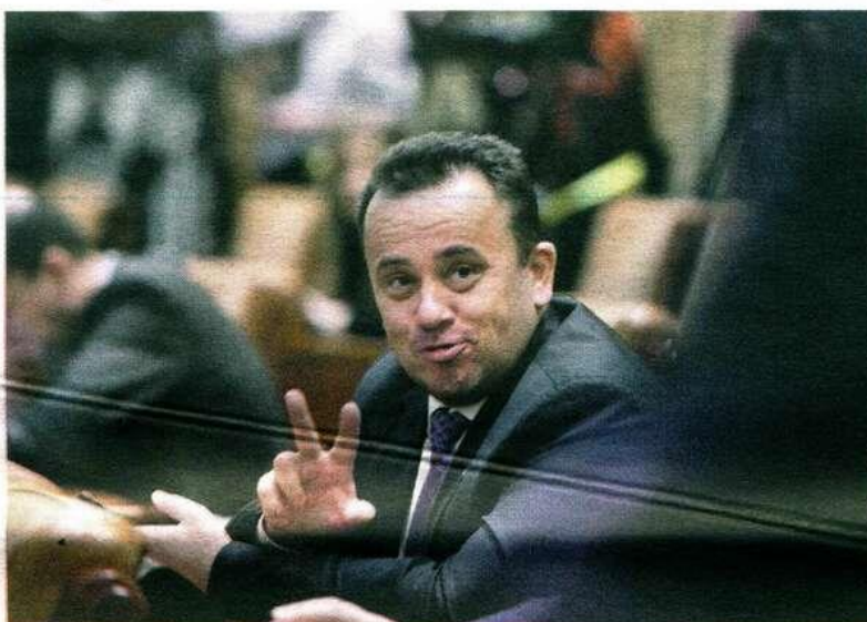
Liviu Pop Fostul ministru al Educației condamnă politica directorilor de școli

Fostul ministru al Educației neagă existența unui „fenomen Brăila”, susținând că totul se rezumă la dorința directorilor de școli de a obține finanțare. „Nu cred că există un fenomen Brăila. Nu