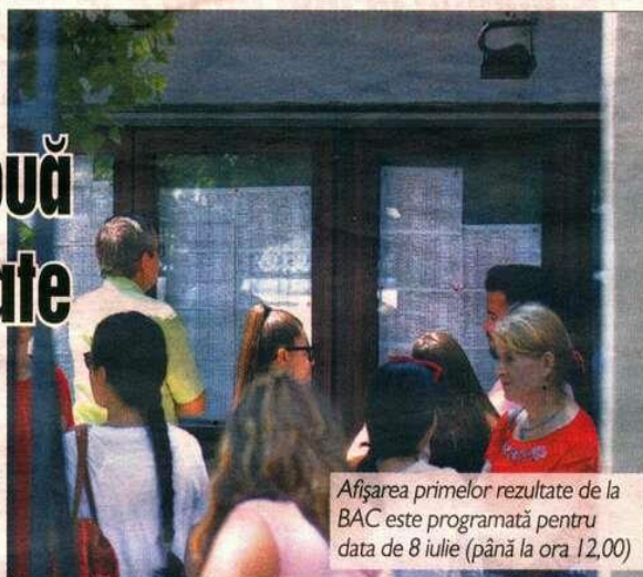
Afișarea primelor rezultate de la BAC este programată pentru data de 8 iulie (până la ora 12,00)

O petiție, inițiată de o tânără proaspătă absolventă al unui liceu cu profil tehnologic, prin care cere Ministerului Educației acordarea a „2 de puncte din oficiu la Bac”, a strâns într-un timp record peste 50.000 de semnături. Acestea vin din partea elevilor și părinților nemulțumiți de gradul de dificultate mare pe care l-a avut unul dintre subiectele de la matematică.