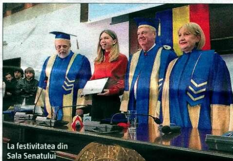
La festivitatea din Sala Senatului