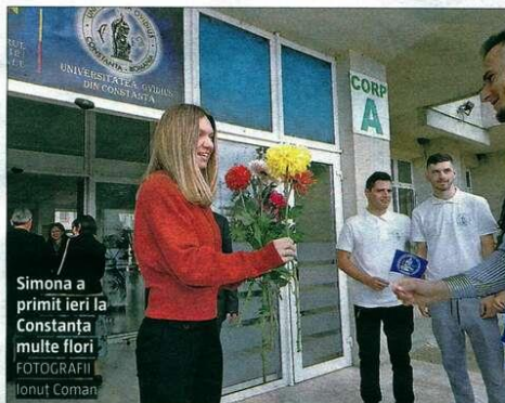
Simona a primit ieri la Constanța multe flori

Primită cu flori și aplauze de către studenți și profesori în Sala Senatului, liderul clasamentului mondial al tenisului feminin a mărturisit că este onorată de decizia universității și le-a transmis un mesaj studenților: "Este o distincție specială, mai ales că sunt în orașul meu natal, diferită față de tot ce am primit până acum, și vreau să le mulțumesc celor de la universitate că s-au gândit la mine. Aici am crescut, a fost un drum lung, dar plin de emoții frumoase. Vreau să mulțumesc orașului meu de suflet, mă întorc mereu cu mare drag la Constanța, aici am pus prima și cea mai importantă cărămidă în construirea performanței.