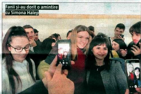
Fanii și-au dorit o amintire cu Simona Halep

Mă gândesc cu adevărat să mă întorc acasă după ce voi termina cariera de sportiv. Nu știu în ce domeniu, dar voi face ceva pentru acest oraș și mă voi implica în multe evenimente. Le spun tuturor studenților care au un vis să muncească pentru a-l îndeplini și să nu cedeze, pen-