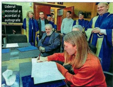
Liderul mondial a acordat și autografe